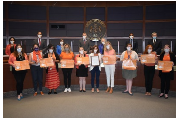
Septiembre como Mes de Acción Contra el Hambre