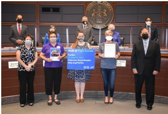
Septiembre como Mes de Conciencia Sobre el Suicidio